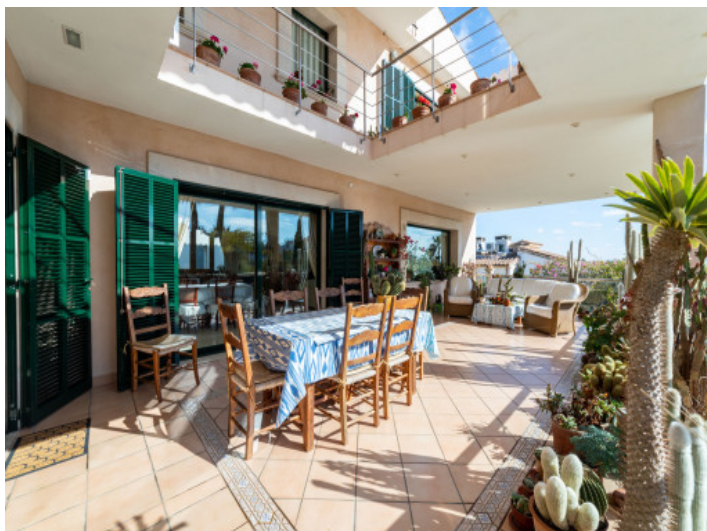
Terraza extensa con comedor