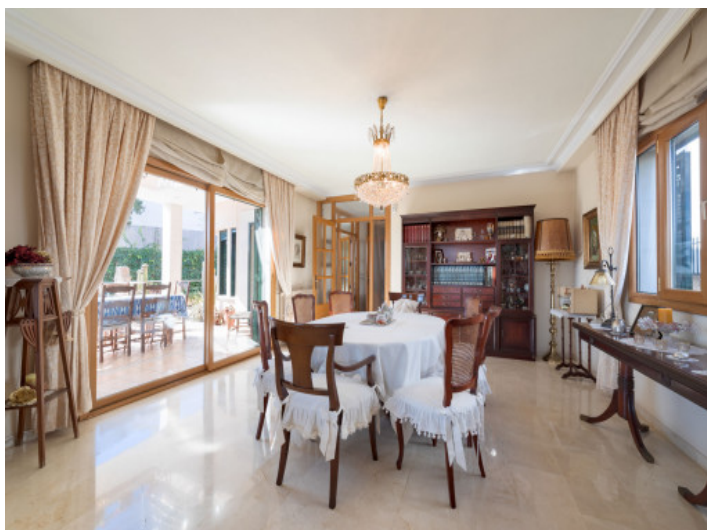
Comedor lleno de luz