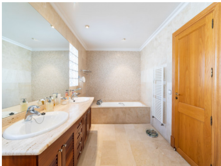
Uno de 4 baños