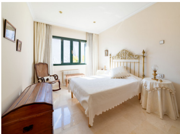
Uno de 4 dormitorios