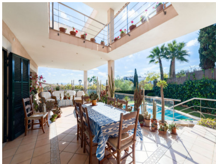
Terraza con acceso a la piscina