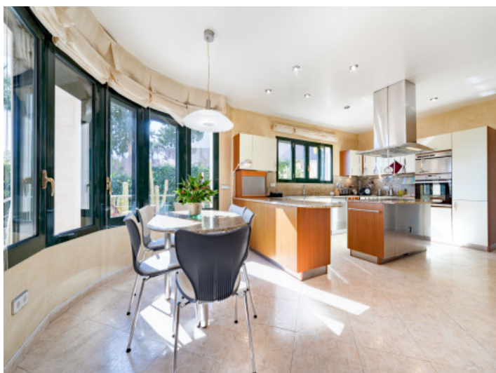
Comedor y cocina