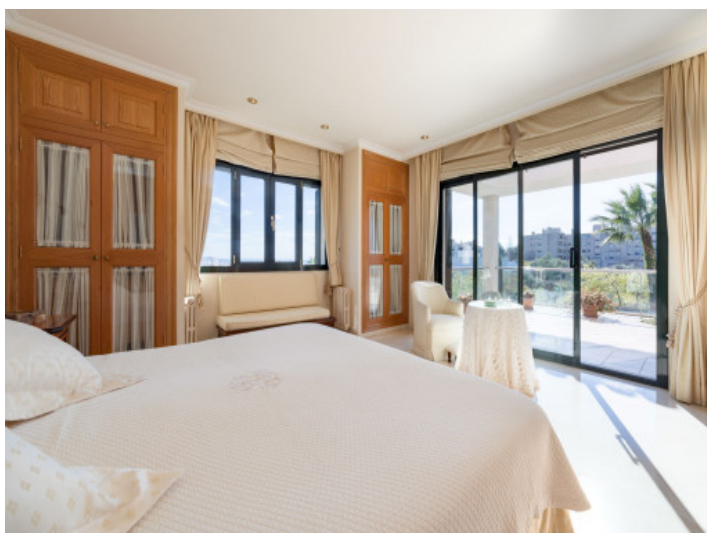
Acceso a la terraza