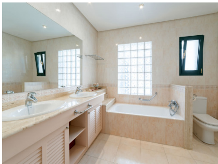
Baño con bañera

Toda la información como mejor se puede saber, salvo por error durante el periodo de venta. Sirva este documento como un informe previo, las bases legales solo serán válidas a través de un contrato de compra acordado ante Notario.