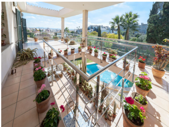
Vistas a Palma desde la terraza