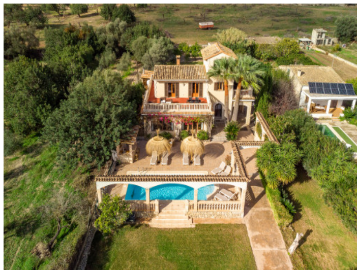
Magnífica finca con licencia vacacional en Biniamar