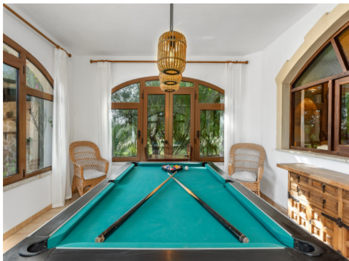
Sala de ocio