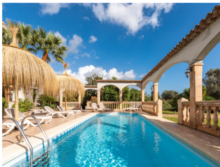
Magnífica finca con licencia vacacional en Biniamar