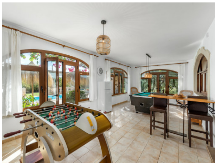
Sala de ocio

Toda la información como mejor se puede saber, salvo por error durante el periodo de venta. Sirva este documento como un informe previo, las bases legales solo serán válidas a través de un contrato de compra acordado ante Notario.