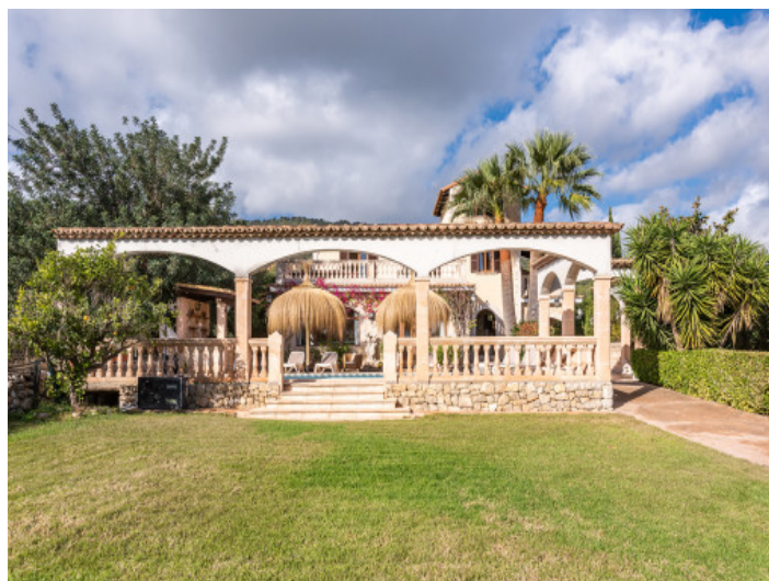
Jardín y finca

Toda la información como mejor se puede saber, salvo por error durante el periodo de venta. Sirva este documento como un informe previo, las bases legales solo serán válidas a través de un contrato de compra acordado ante Notario.