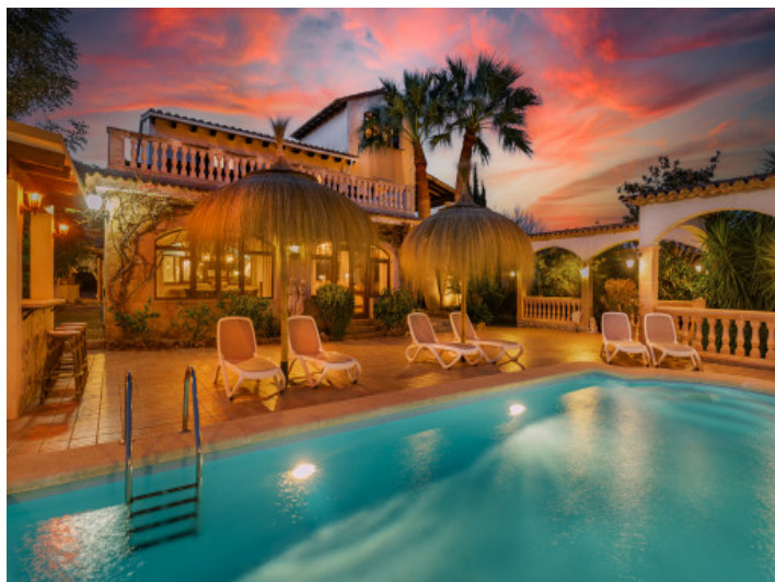
Piscina por la noche