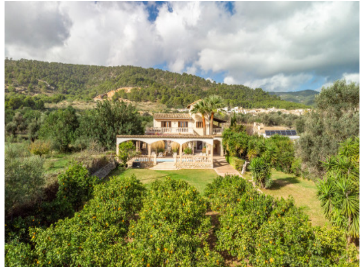
A vista de pájaro