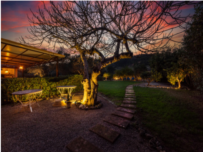
Vista al jardín