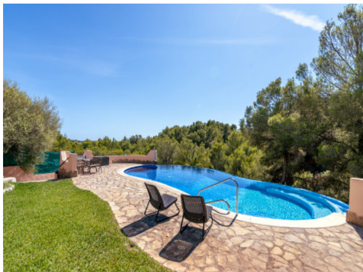
Zona de piscina