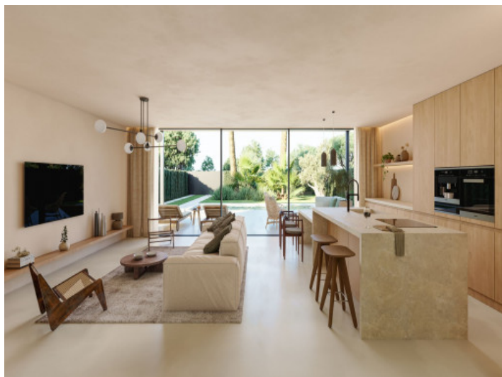
Salon - Comedor