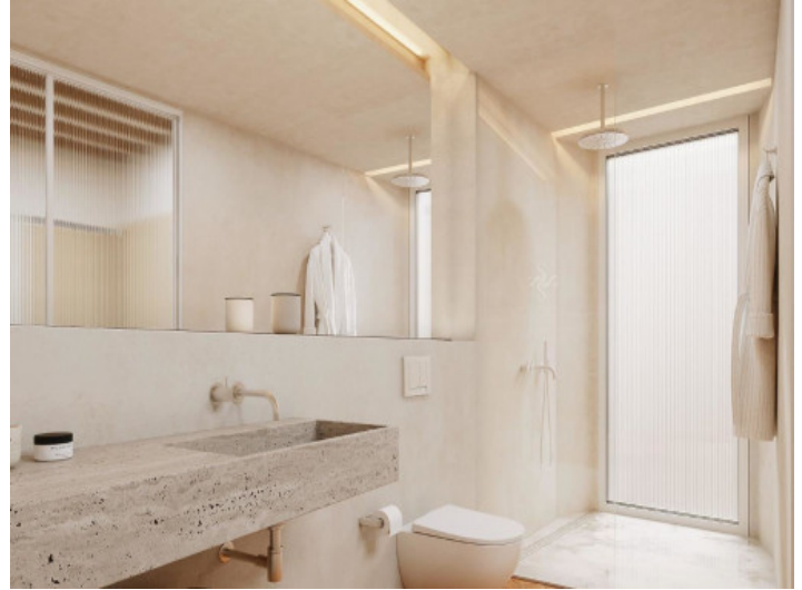
Baño en suite