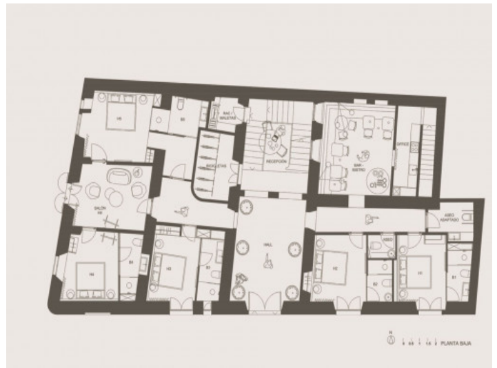
Plano planta baja