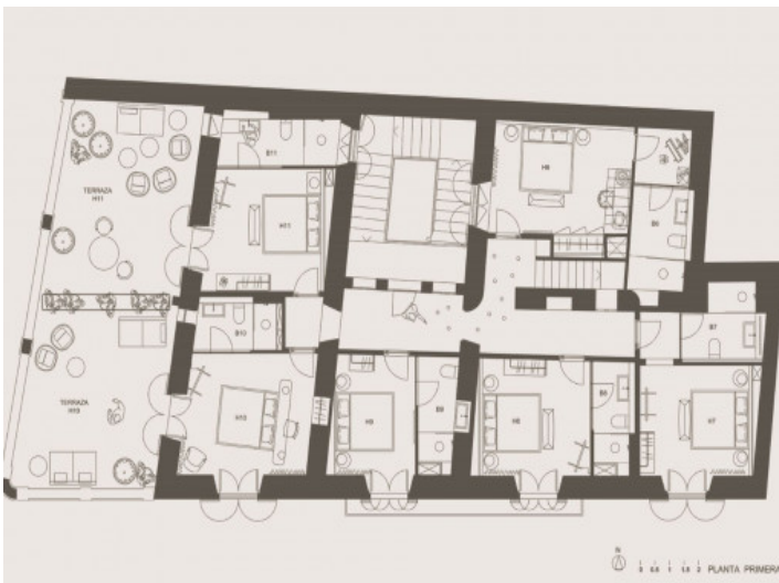
Plano 1. piso