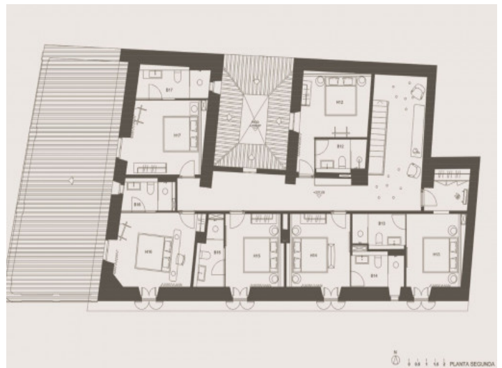
Plano 2. piso

Toda la información como mejor se puede saber, salvo por error durante el periodo de venta. Sirva este documento como un informe previo, las bases legales solo serán válidas a través de un contrato de compra acordado ante Notario.