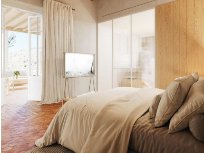
Todos los dormitorios con baño en suite