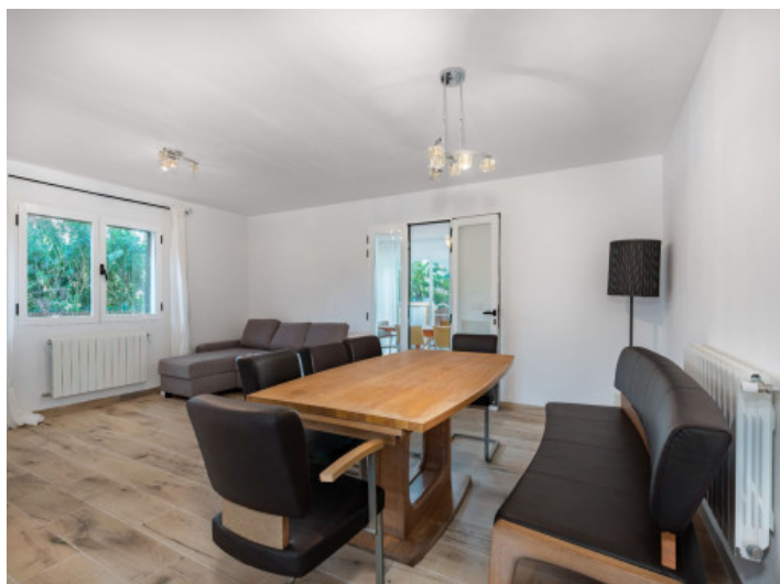
Salón - comedor planta baja