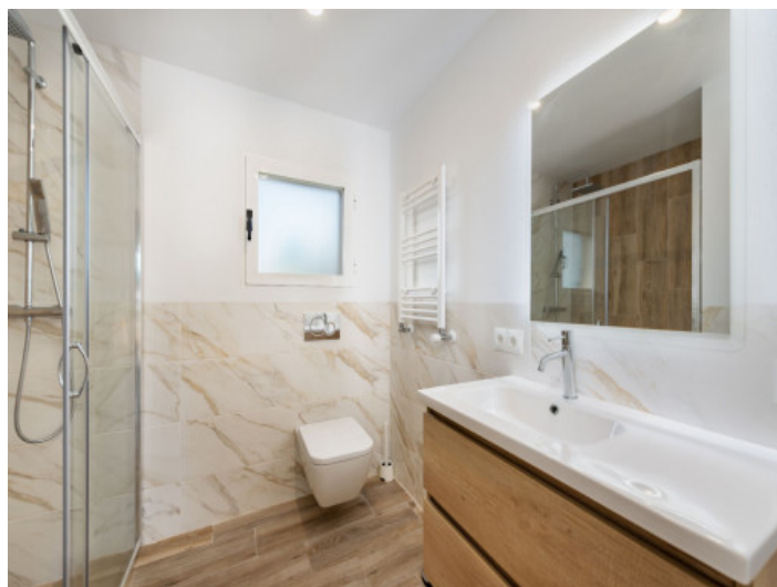
Uno de 2 baños

Toda la información como mejor se puede saber, salvo por error durante el periodo de venta. Sirva este documento como un informe previo, las bases legales solo serán válidas a través de un contrato de compra acordado ante Notario.