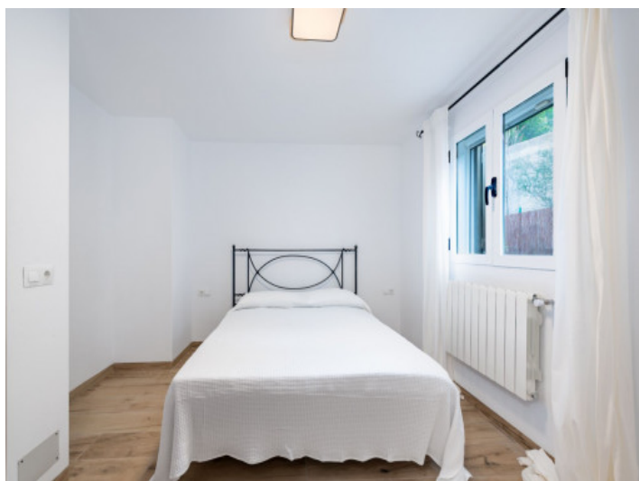
Segundo dormitorio planta baja