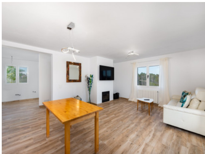
Salón con chimenea