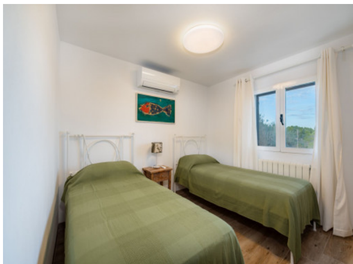
Segundo dormitorio primer piso