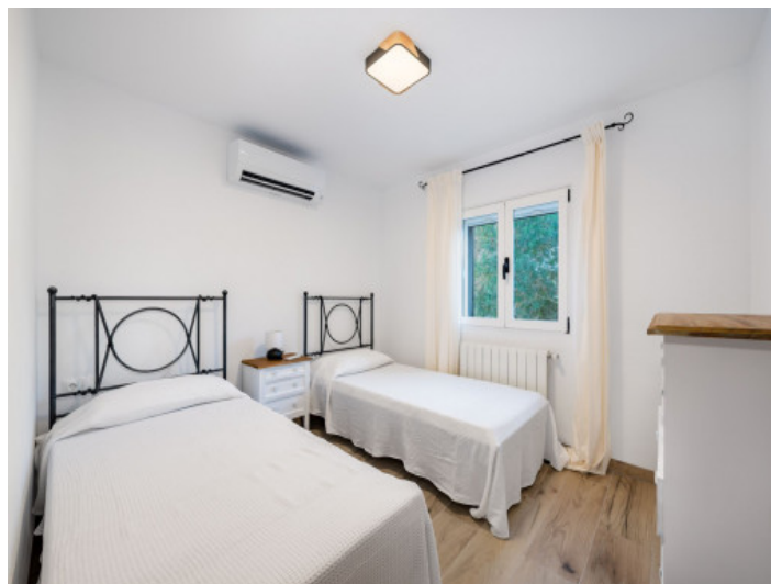
Dormitorio planta baja