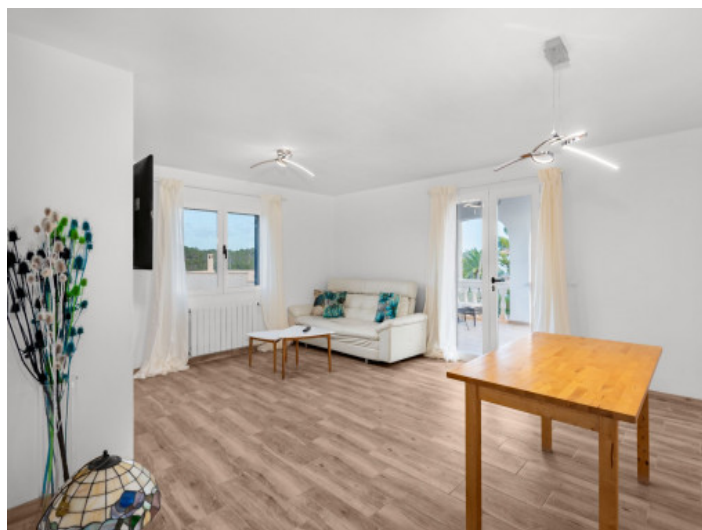
Salón - comedor planta primera

Toda la información como mejor se puede saber, salvo por error durante el periodo de venta. Sirva este documento como un informe previo, las bases legales solo serán válidas a través de un contrato de compra acordado ante Notario.