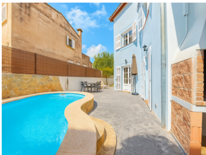
Piscina en la parte trasera

Toda la información como mejor se puede saber, salvo por error durante el periodo de venta. Sirva este documento como un informe previo, las bases legales solo serán válidas a través de un contrato de compra acordado ante Notario.