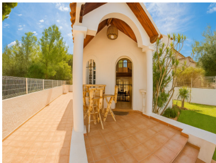
Entrada con terraza

Toda la información como mejor se puede saber, salvo por error durante el periodo de venta. Sirva este documento como un informe previo, las bases legales solo serán válidas a través de un contrato de compra acordado ante Notario.