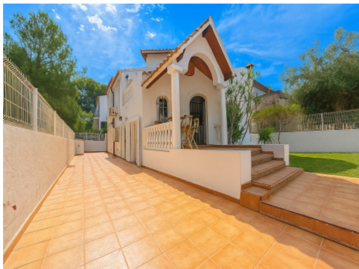
Vista de la entrada y acceso principal