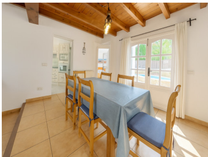
Comedor con acceso al jardín