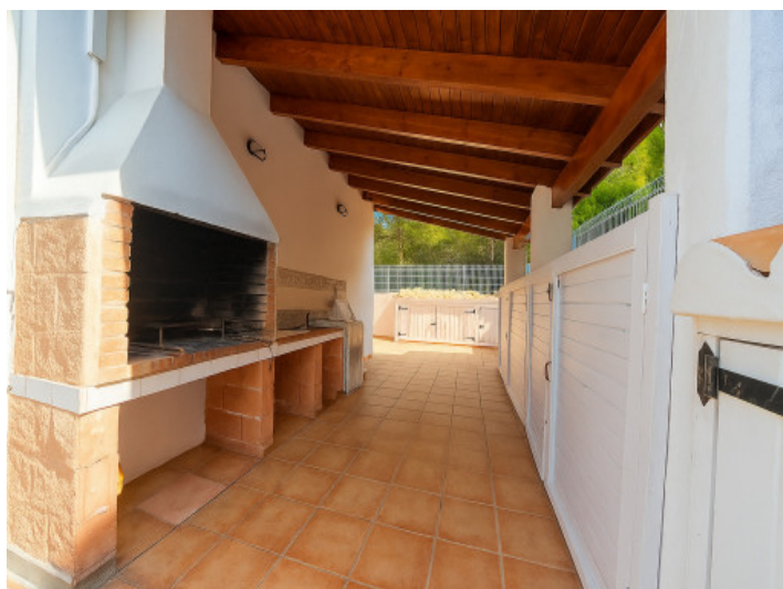
Zona de barbacoa cubierta con almacenaje