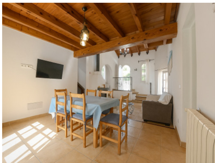
Comedor y salón a la vista