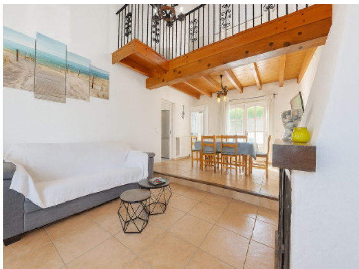
Salón-comedor con galería