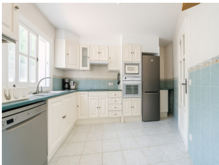
Cocina equipada y amueblada