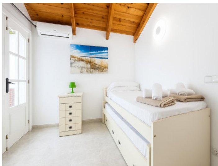
Primer dormitorio de dos en planta alta