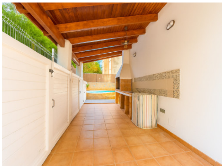
Zona de barbacoa en el jardín