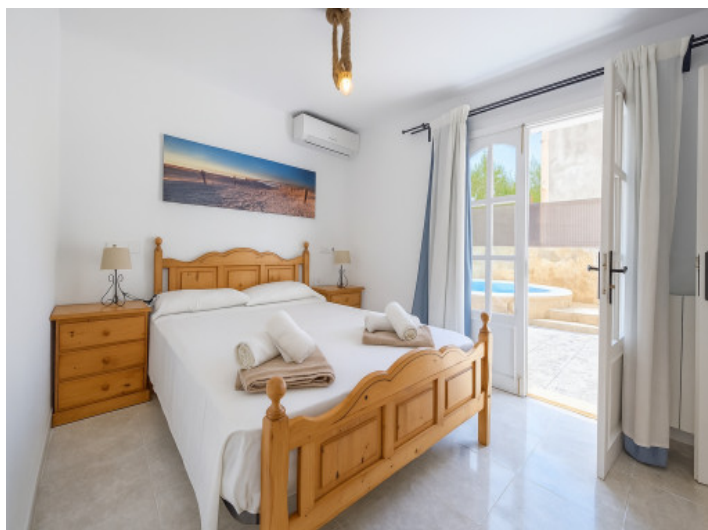
Dormitorio principal con acceso a la piscina