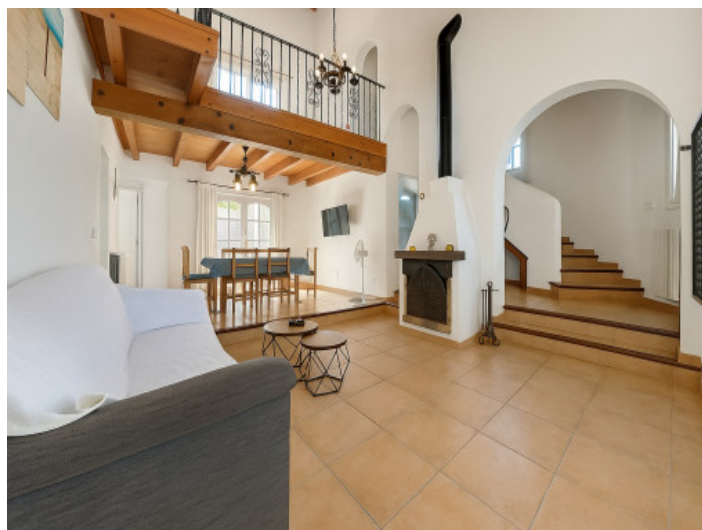
Salón con chimenea acogedora

Toda la información como mejor se puede saber, salvo por error durante el periodo de venta. Sirva este documento como un informe previo, las bases legales solo serán válidas a través de un contrato de compra acordado ante Notario.