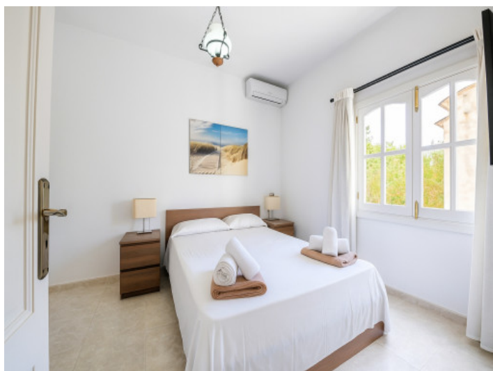
Uno de los dos dormitorios en la planta superior.