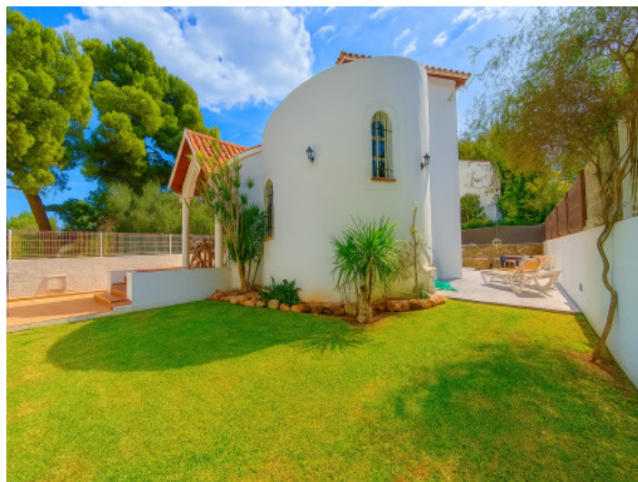
Vista del jardín hacia la casa