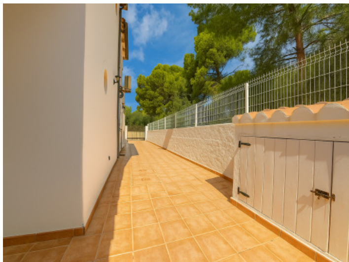
Vista de la entrada para coches