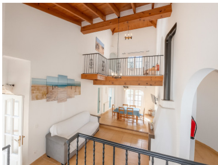
Salón visto desde la entrada