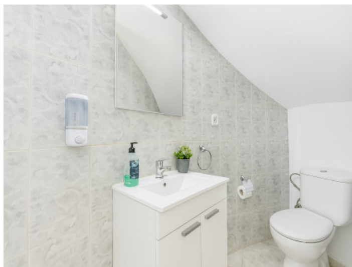
Aseo de invitados en planta baja