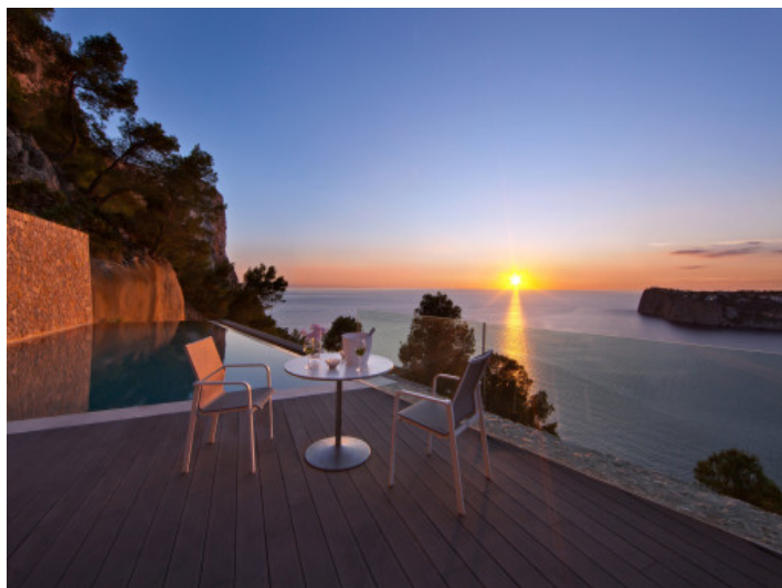
Vista atmosférica de la terraza al atardecer con vistas al mar