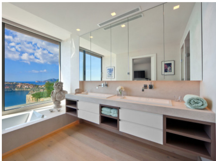
Baño amplio con fantásticas vistas al mar