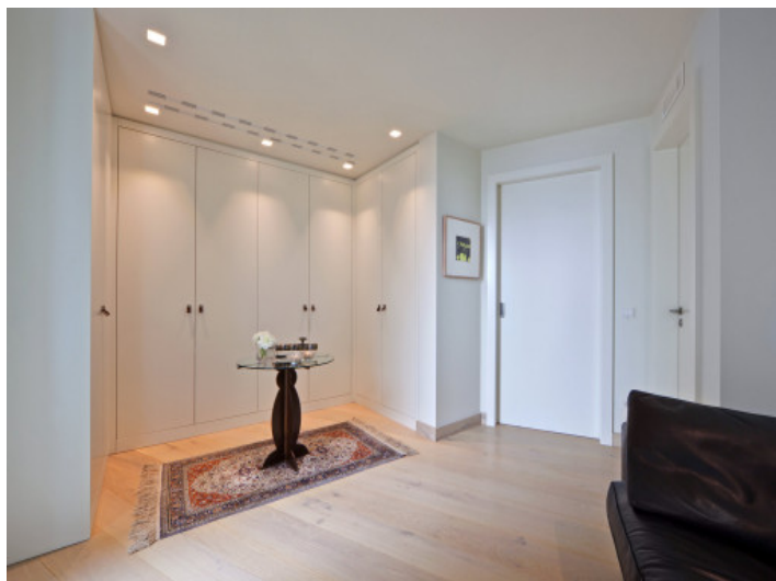
Uno de los tres dormitorios con vestidor