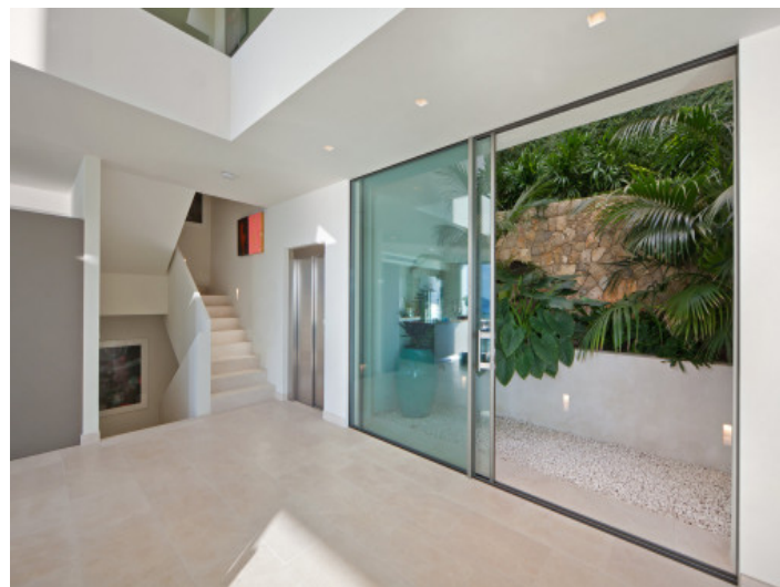
Entrada moderna con ascensor y patio ajardinado