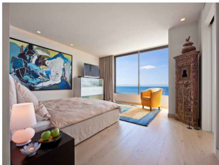
Dormitorio con baño en suite y espectaculares vistas al mar

Toda la información como mejor se puede saber, salvo por error durante el periodo de venta. Sirva este documento como un informe previo, las bases legales solo serán válidas a través de un contrato de compra acordado ante Notario.