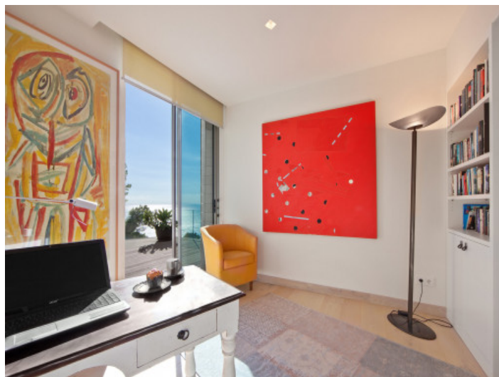
Oficina independiente con acceso a la terraza con vistas al mar