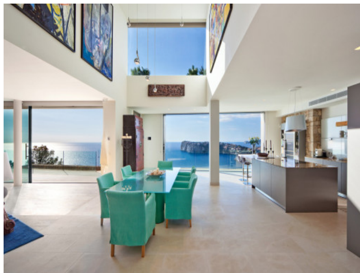
Cocina abierta y comedor con techos altos y unas impresionantes vistas al