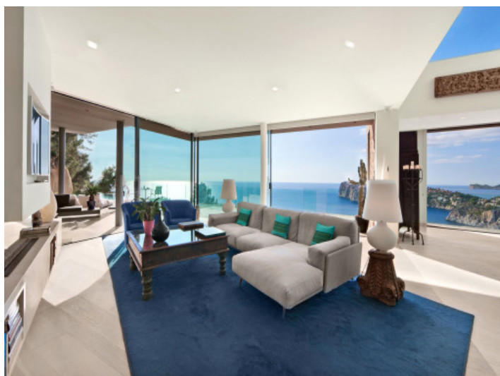
Amplia zona de estar con vistas panorámicas al mar y acceso a la terraza