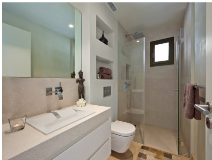
Uno de los tres baños

Toda la información como mejor se puede saber, salvo por error durante el periodo de venta. Sirva este documento como un informe previo, las bases legales solo serán válidas a través de un contrato de compra acordado ante Notario.