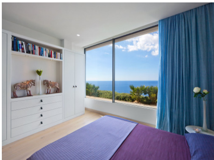
Uno de los tres dormitorios con vistas al mar