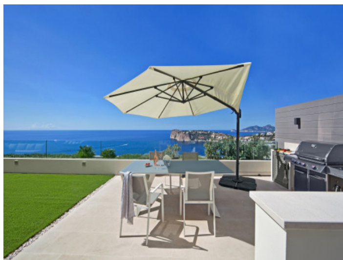
Cocina exterior con amplias vistas al mar – cocinar y disfrutar al aire libre