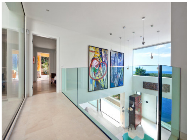
Galería elegante con vistas panorámicas al mar