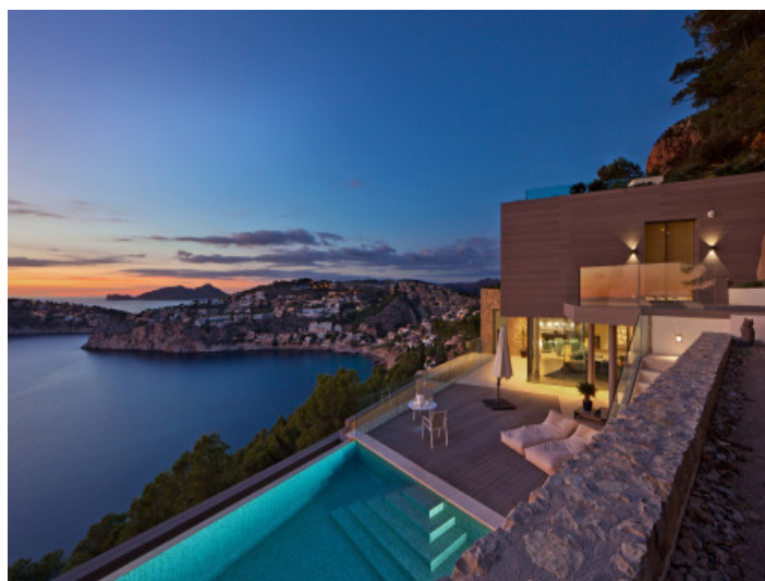
Ambiente nocturno con iluminación y vistas al mar