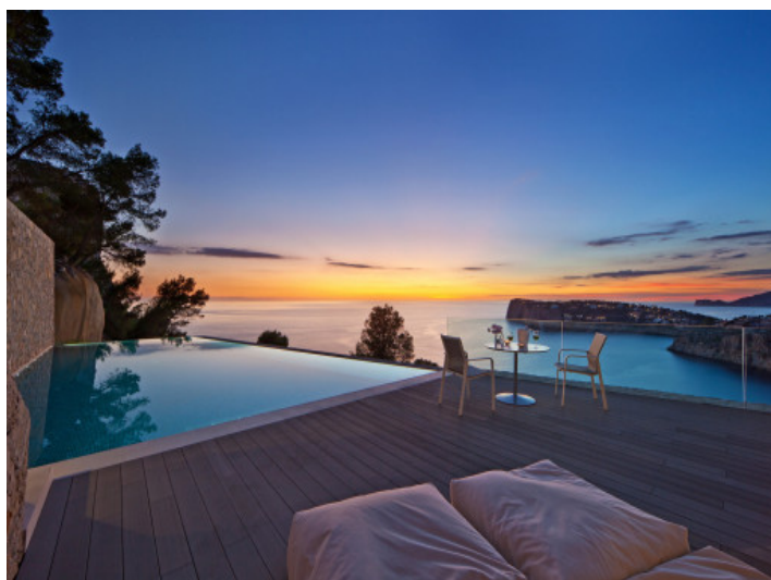
Ambiente de puesta de sol