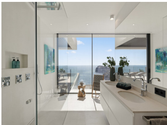
Baño de diseño con vistas al mar