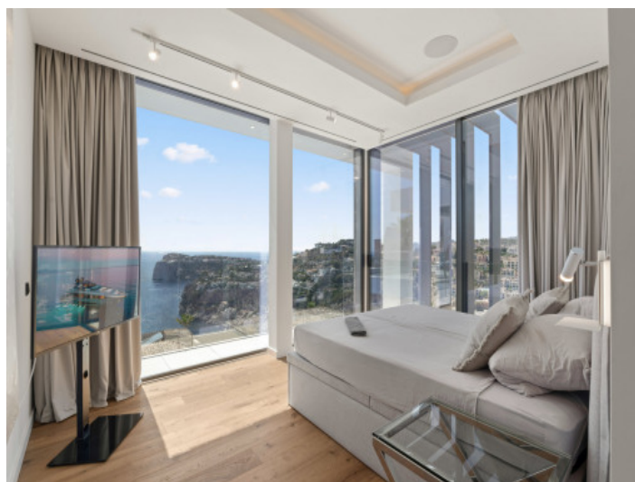
Dormitorio con ventanales de suelo a techo