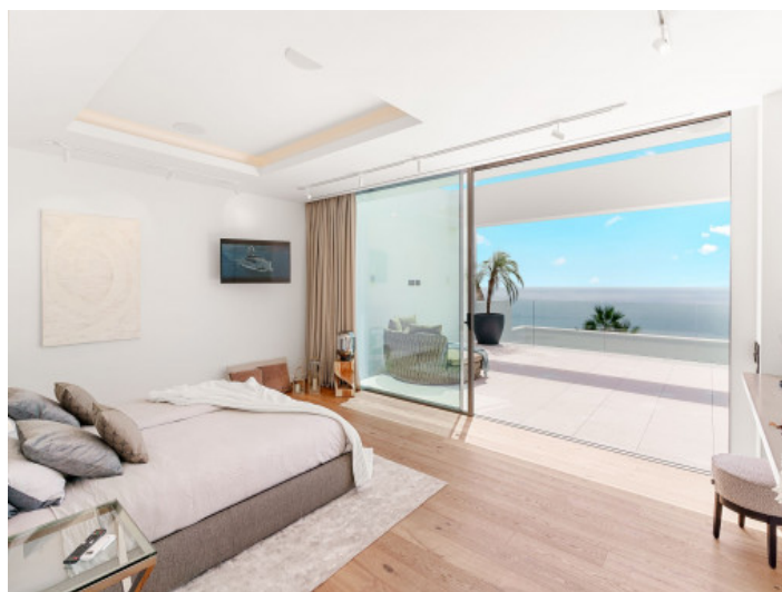
Dormitorio con acceso a la terraza