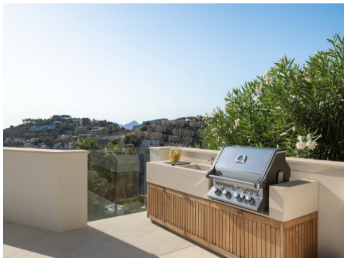
Cocina exterior de alta calidad