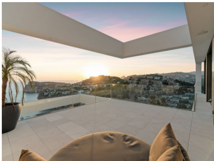
Vistas de ensueño