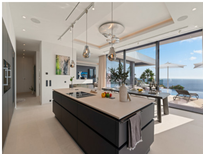
Isla de cocina de diseño