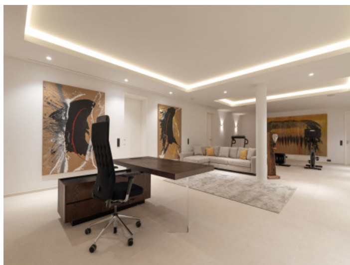
Despacho y gimnasio

Toda la información como mejor se puede saber, salvo por error durante el periodo de venta. Sirva este documento como un informe previo, las bases legales solo serán válidas a través de un contrato de compra acordado ante Notario.