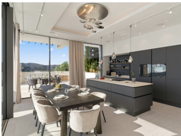
Cocina de diseño con elegante zona de comedor