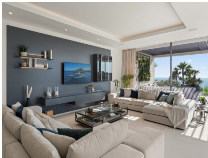
Acogedor salón de diseño