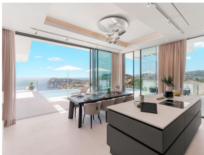
Zona de comedor con vistas fantásticas