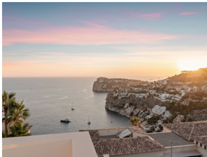
Impresionantes vistas al mar