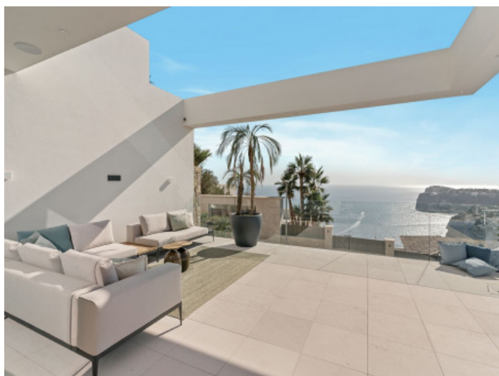
Terraza con vistas al mar