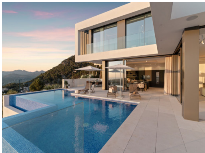
Amplia terraza y zona exterior