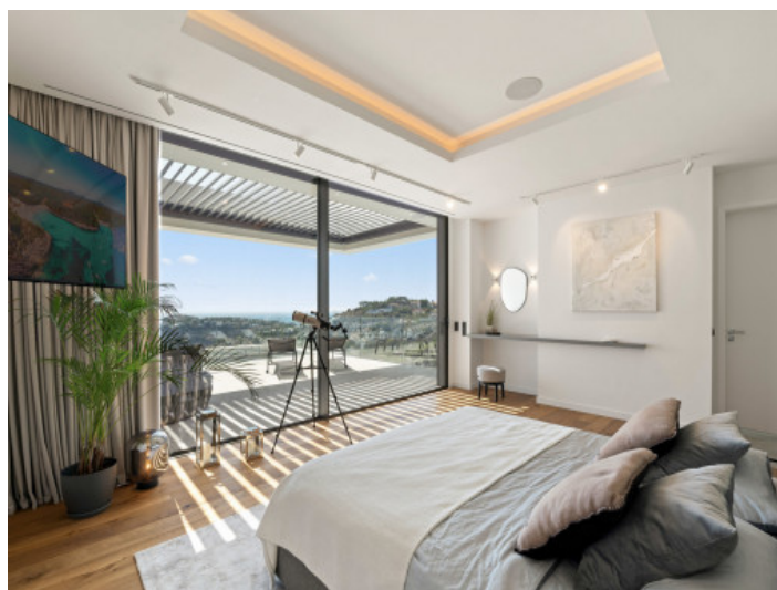
Uno de los 5 dormitorios