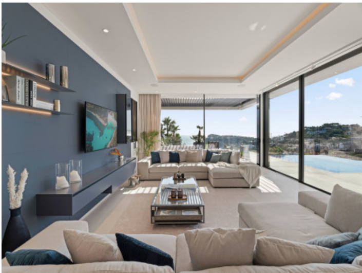
Sala de estar con magníficas vistas al mar