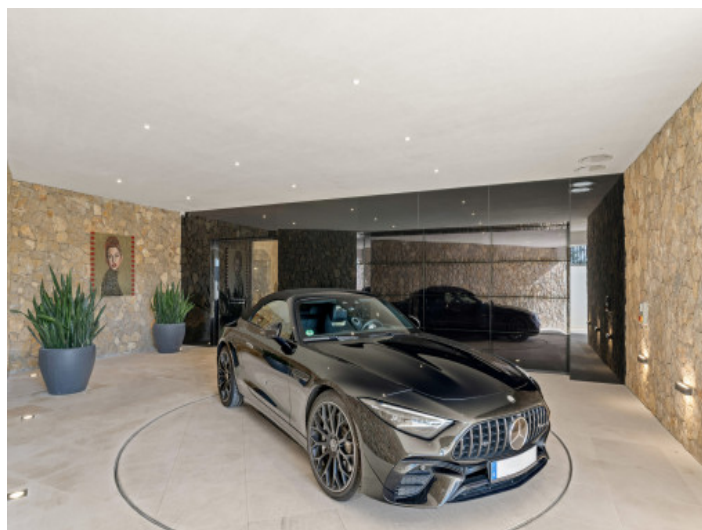
Entrada de la casa con plataforma giratoria

Toda la información como mejor se puede saber, salvo por error durante el periodo de venta. Sirva este documento como un informe previo, las bases legales solo serán válidas a través de un contrato de compra acordado ante Notario.