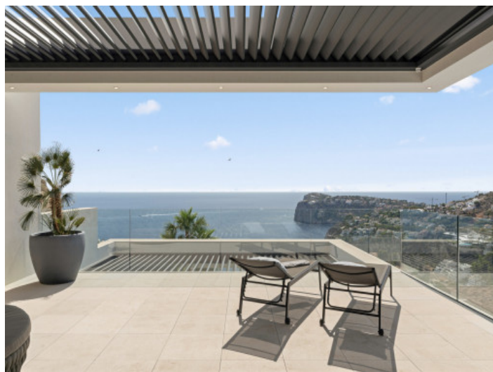
Terraza cubierta con vistas al mar

Toda la información como mejor se puede saber, salvo por error durante el periodo de venta. Sirva este documento como un informe previo, las bases legales solo serán válidas a través de un contrato de compra acordado ante Notario.