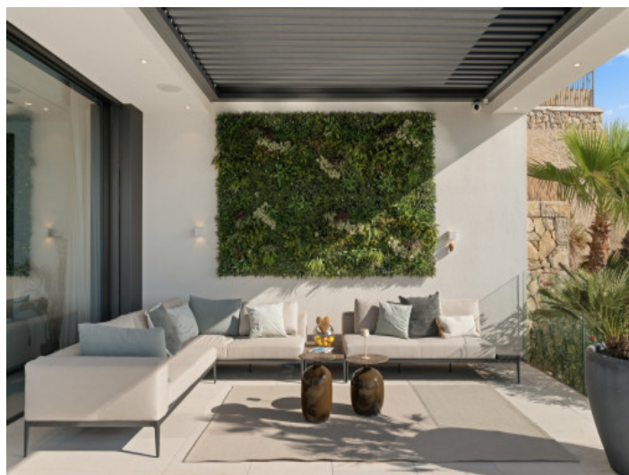
Acogedora zona chill-out

Toda la información como mejor se puede saber, salvo por error durante el periodo de venta. Sirva este documento como un informe previo, las bases legales solo serán válidas a través de un contrato de compra acordado ante Notario.