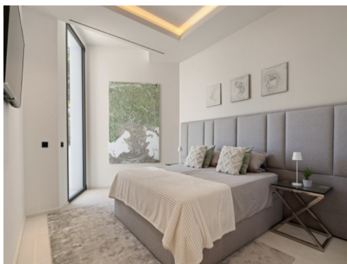
Uno de los 5 dormitorios