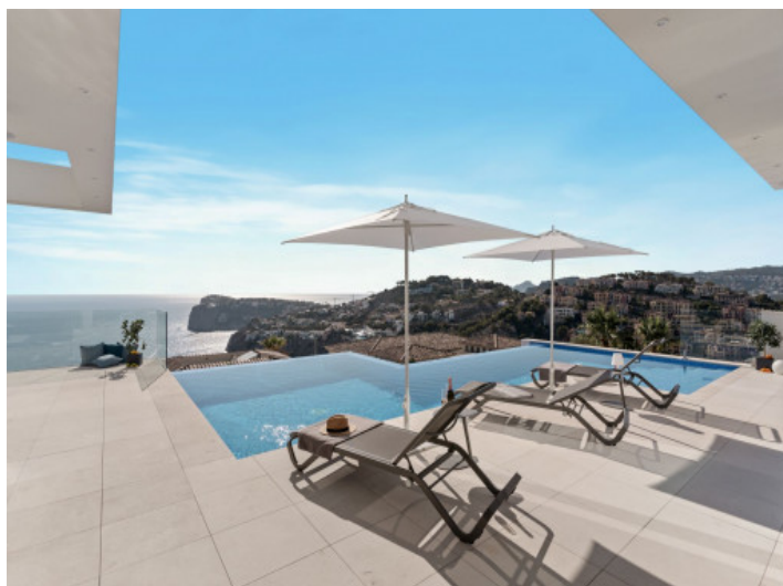
Terraza con vistas al mar