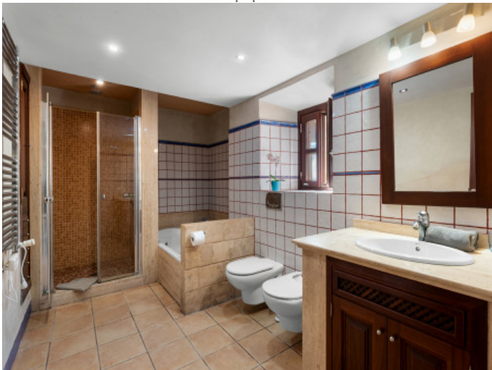
Baño del dormitorio principal