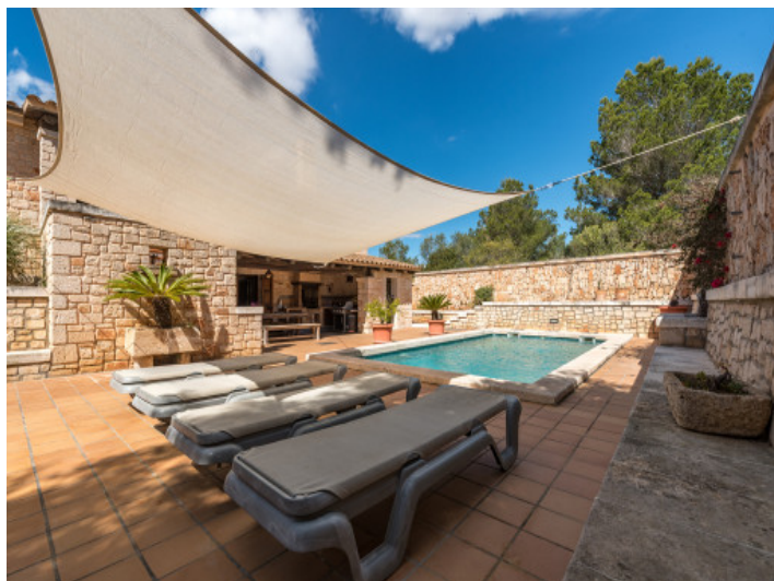
Terraza solàrium junto a la piscina