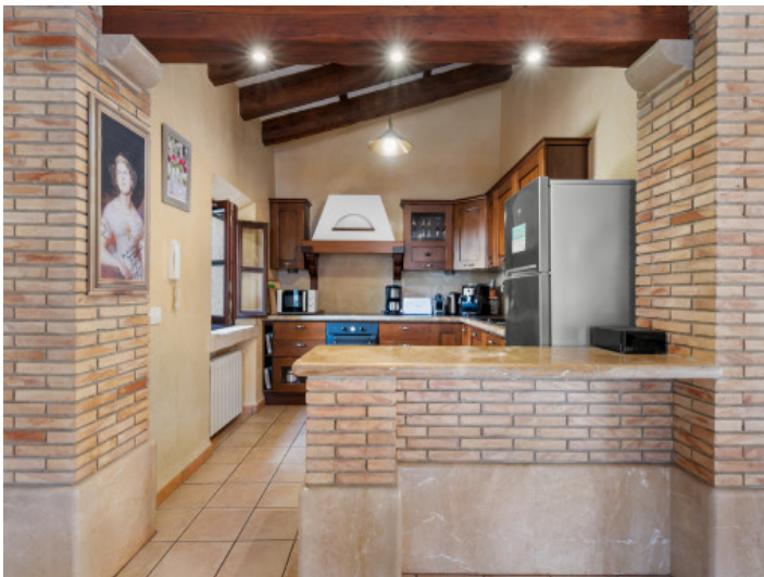
Cocina contigua a la zona de estar