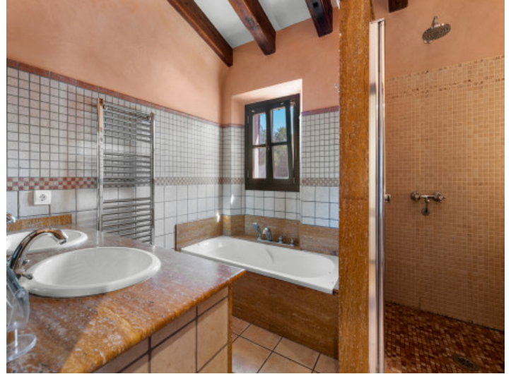
Baño en la planta superior