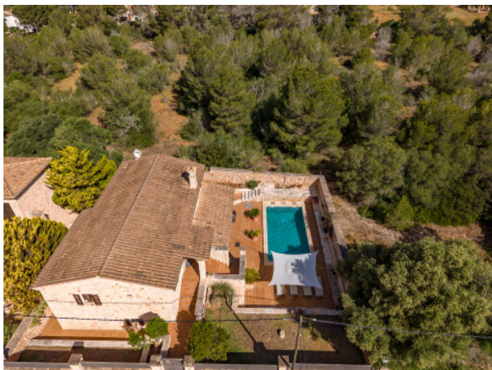
Ubicado directamente junto a un terreno forestal no urbanizable