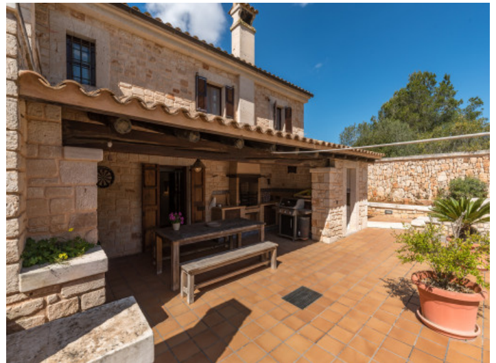
Terraza cubierta junto a la casa con acceso a la planta baja

Toda la información como mejor se puede saber, salvo por error durante el periodo de venta. Sirva este documento como un informe previo, las bases legales solo serán válidas a través de un contrato de compra acordado ante Notario.