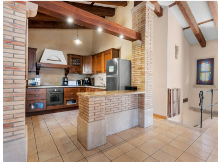
Cocina contigua a la zona de estar