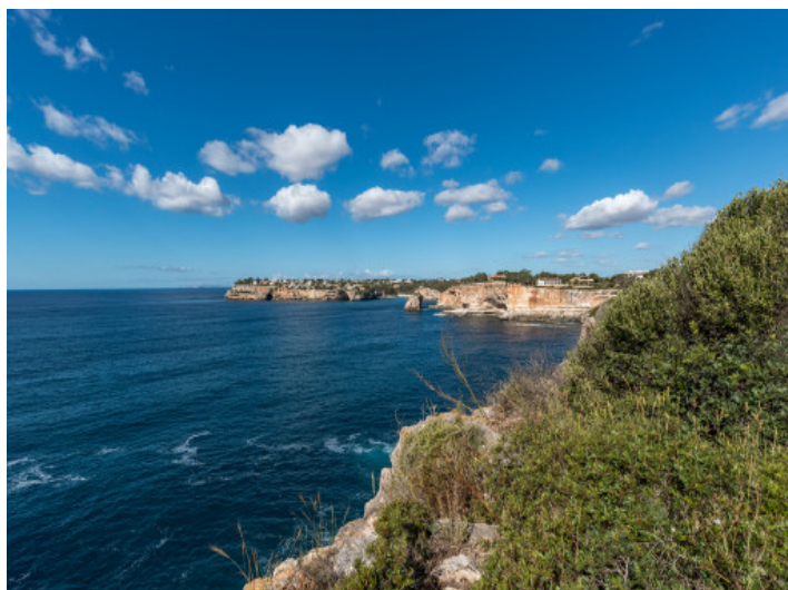
Vistas hacia Es Pontàs