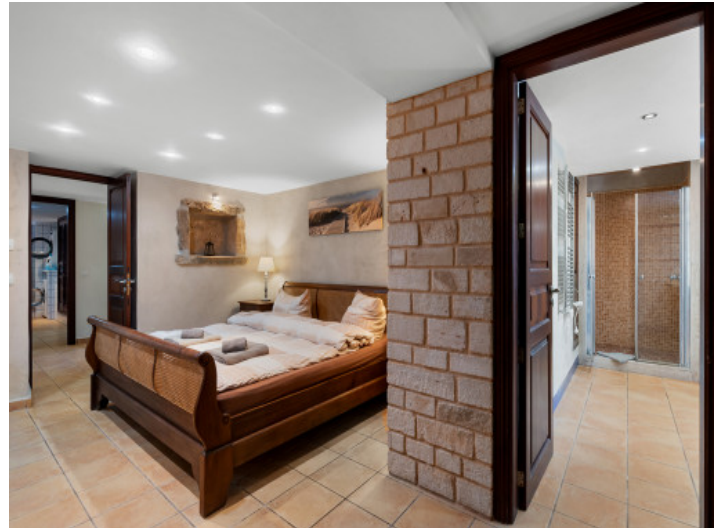
Dormitorio principal con baño en suite