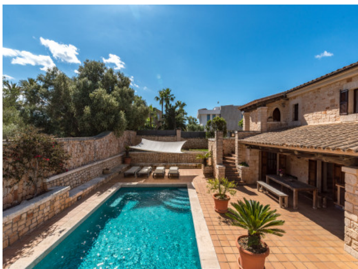
La terraza y la piscina se encuentran en un nivel ligeramente inferior