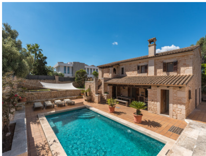
La terraza y la piscina se encuentran en un nivel ligeramente inferior