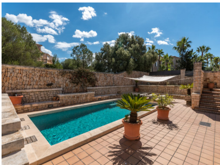
Piscina con zona de estar integrada de obra