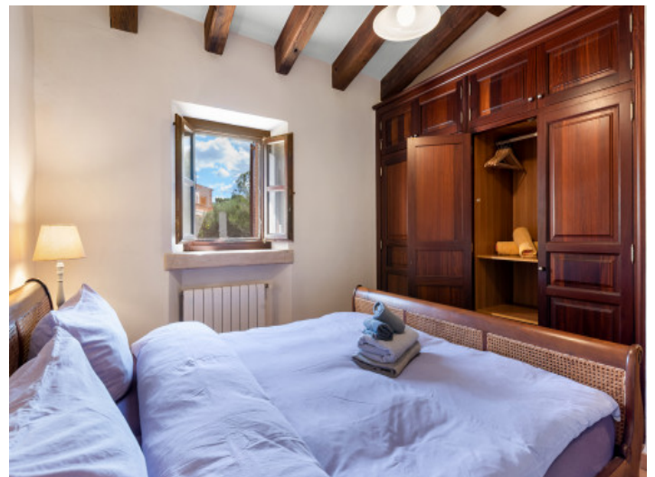
Primer dormitorio de invitados en la planta superior

Toda la información como mejor se puede saber, salvo por error durante el periodo de venta. Sirva este documento como un informe previo, las bases legales solo serán válidas a través de un contrato de compra acordado ante Notario.