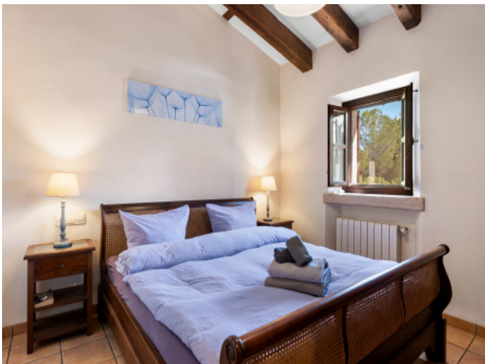
Primer dormitorio de invitados en la planta superior