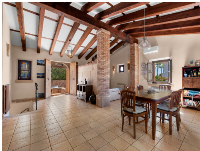
Recibidor acogedor con transición fluida hacia la zona de estar de concepto abierto

Toda la información como mejor se puede saber, salvo por error durante el periodo de venta. Sirva este documento como un informe previo, las bases legales solo son válidas a partir de un contrato de compra acordado ante Notario.