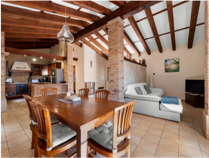
Zona de estar y comedor de concepto abierto